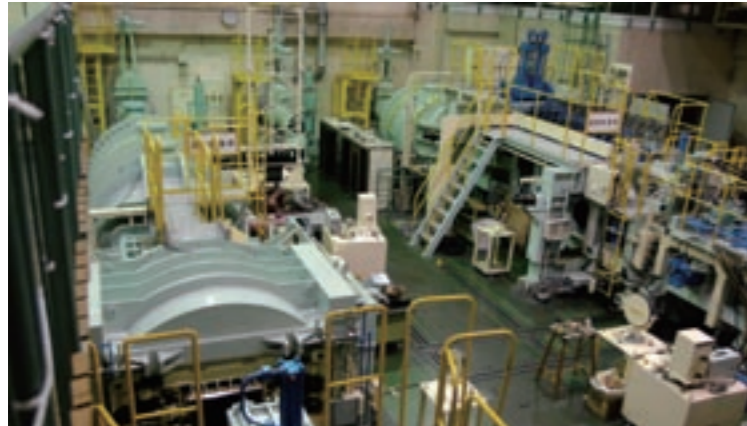
宇宙研の施設を見学して回る参加者たち。見学コースは模型展示スペース（中段左）と、イオンエンジン実験施設（上段と中段右）、高速気流総合実験設備（下段）。