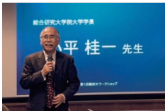
開会の辞を述べる小平学長

総研大の学生たちが交流する場がもうひとつ生まれた。学生が企画し、運営する「総研大ワークショップ」だ。2007年11月8日～9日に宇宙航空研究開発機構・宇宙科学研究本部で開かれた第1回ワークショップではどのような交流と出会いがあったのだろうか。